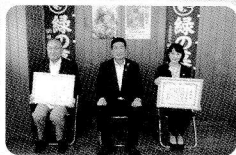
緑の募金感謝状贈呈