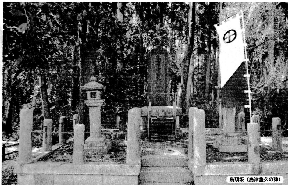
鳥頭坂（島津豊久の碑）