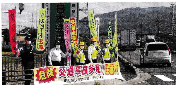
● 5月・「交通死亡事故多発県内警報」発令による人波作戦