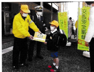
● 4月・新入学児童に反射材付きランドセルカバー贈呈