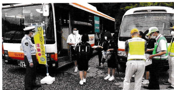
● 7月・上石津中学MSJリーダーズと共に下校時の交通安全指導