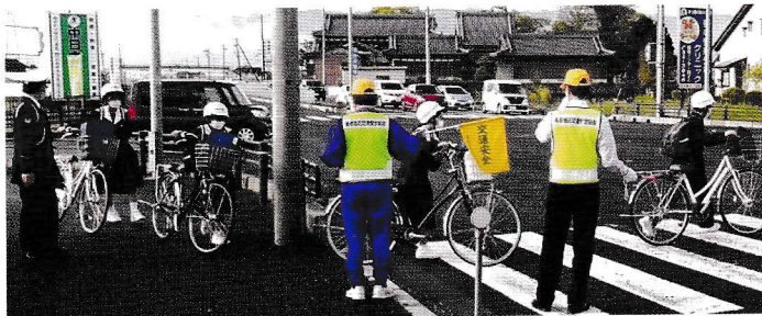
● 4月・池辺地内にて登校時の自転車通学生に交通安全指導