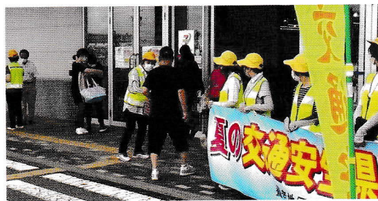
● 7月・オークワにて啓発活動