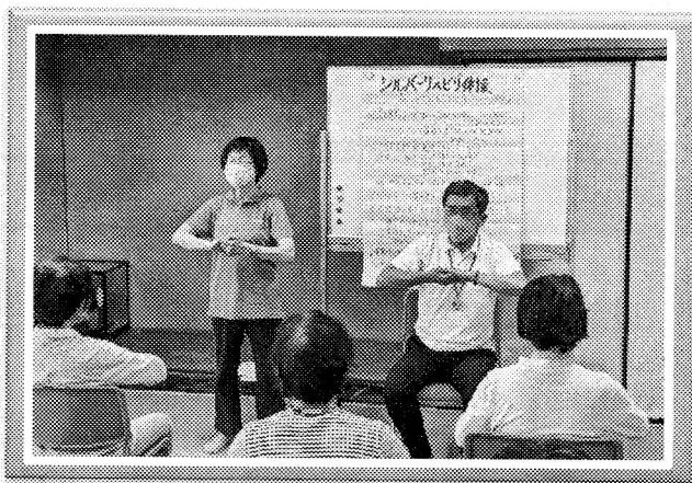
北ひまわり会(北地区)

大垣市では、市民の皆さまがいつまでもいきいき過ごせる地域づくりのためのボランティアとして、シルバーリハビリ体操指導士の養成を行っています。現在、55名のシルバーリハビリ体操指導士が誕生しています。コロナ禍でなかなか活動ができませんでしたが、少しずつ活動の場を拡げています。