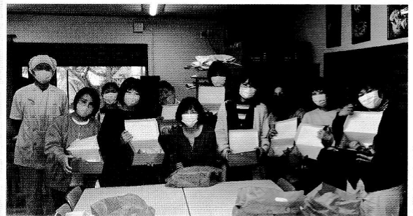
▲午後の部の集合写真

パンの森の自然の中で楽しく簡単なお菓子パンや調理パン作り体験を行いました。午前と午後の部に別れ合計26名の方が参加してくださいました。今回は4種類のお惣菜パンを作りました。家庭では1度に何種類も製作することが大変なので、パン作りが初めての方はもちろん、経験者も楽しめる内容でした。パンが焼きあがるまでの時間も、学校の話や子どもの話など、会話が弾み有意義な時間となりました。