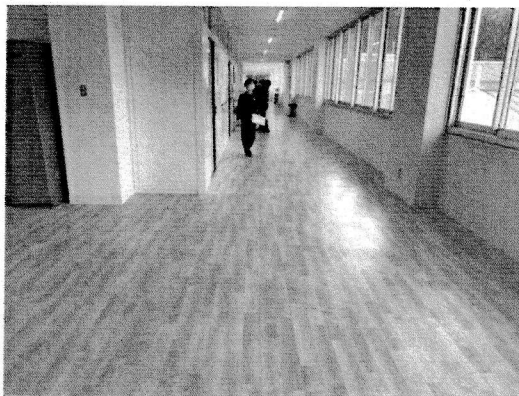
壁面や床板も明るくなりました