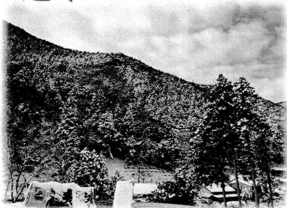
冬の自宅前の様子

時山に来て7カ月、越冬もできたのでそろそろ時山について話す資格があるのかな?と思います(笑)