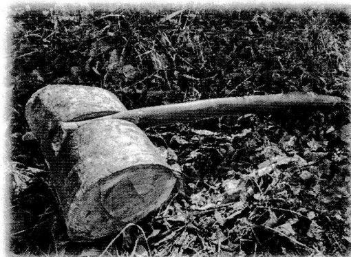
私が作成した木槌

木槌も4回作りました(作り方も使い方も悪いのかすぐ壊れてしまいます)。木槌の振り下ろし方も、肘から落としたり肩甲骨を上げてから降ろしたり膝を抜いたりしてより楽に割れるように試行錯誤しています。綺麗に割れたときの音や爽快感はたまらないです。