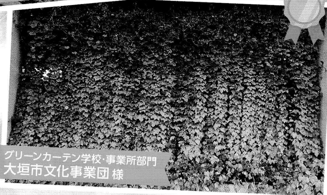
グリーンカーテン学校・事業所部門 大垣市文化事業団様