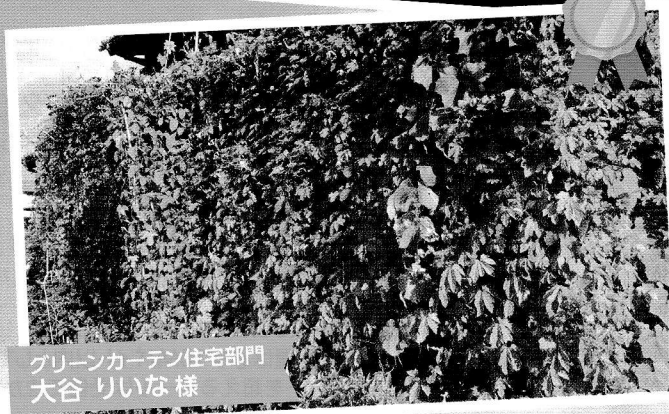
グリーンカーテン住宅部門 大谷 りいな様