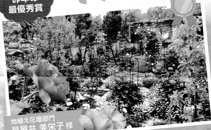
地植え花壇部門 見屋井 美栄子様