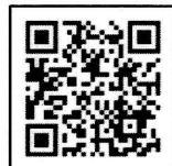
番組アドレスQRコード

4月に大垣ケーブルテレビで放送された「水都ピア通信おおがき」で時山炭が紹介されましたので、見逃がされた方はQRコードを読みとってご覧ください。