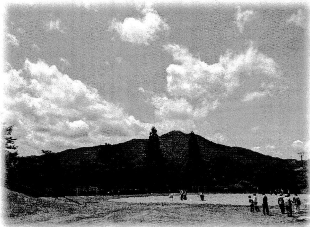
グランドゴルフ 烏帽子岳と