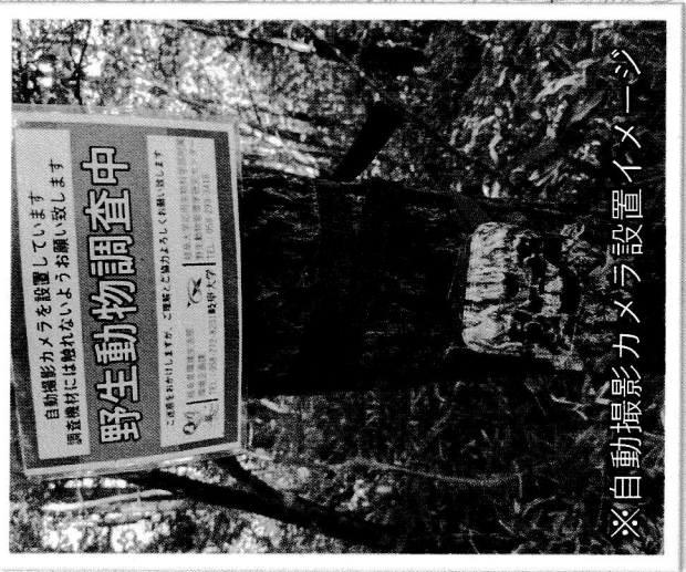
※自動撮影カメラ設置イメージ