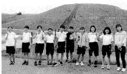
クラスのみんなで記念写真(昼飯大塚古墳)