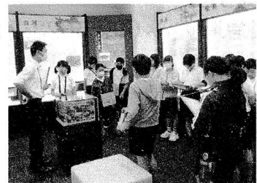
芭蕉の旅の足跡を学びました