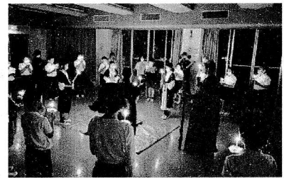
静かな中でのキャンドルセレモニー