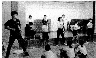
タベの活動ではダンスを披露しました