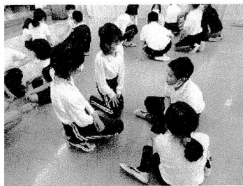
他校の子と協力してグループ活動をしました