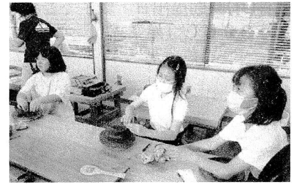
陶芸体験では自分のオリジナル作品を作りました