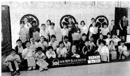
4校のみんなで記念写真(関ヶ原古戦場記念館)

来年の4月からは、どの学年の子どもたちもこうした仲間たちと過ごすことになりませんが、彼らがこれまでそれぞれの学校で伸ばしてきた個性を、多くの友だちとの中でも十分発揮できることを、さらには多様な体験によって、より多くのことを学べることを願っています。