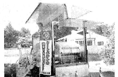
【シートベルト装着時衝突体験車】

◆9月5日(火)スクールセーフティ事業として、西濃振興事務所、大垣市危機管理室、JAF、養老警察署よりシートベルト着用の大切さについて6年生が体験を通して学びました。