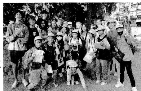
アメリカから来ていた高校生と記念撮影