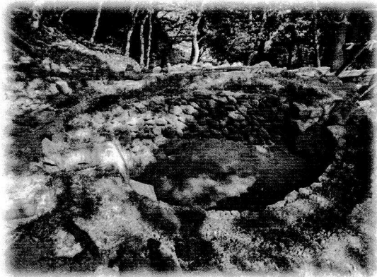
床や側積みも前回よりも可能な限り入念に作業をしています。

作って壊す。この作業からも少しですがいろいろなものが見えてきました。原因を考慮しながら、また今回が師匠達から窯造りを学べる最後の機会と心得てしっかり励んでいきたいと思えます。