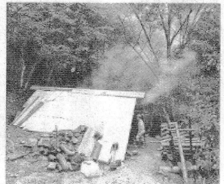
山間にたたずむ新しい炭焼き窯 ＝同