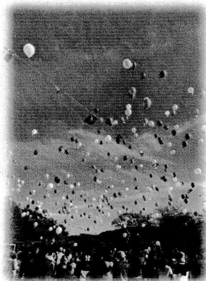
バルーンリリースの様子

7日(土)に時山刺し子展がありました。市内外からたくさんの方が見えました。時山刺し子はまだまだ元気です！