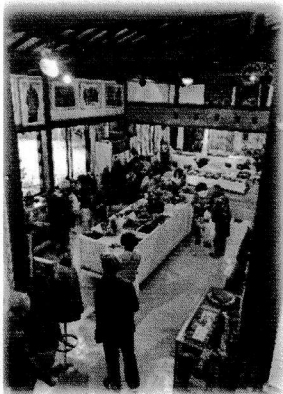
時山刺し子展の様子