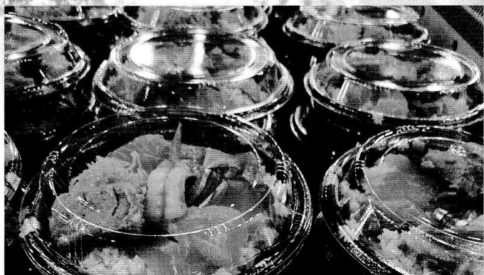
(株) 河合商店 ▶ 海鮮丼