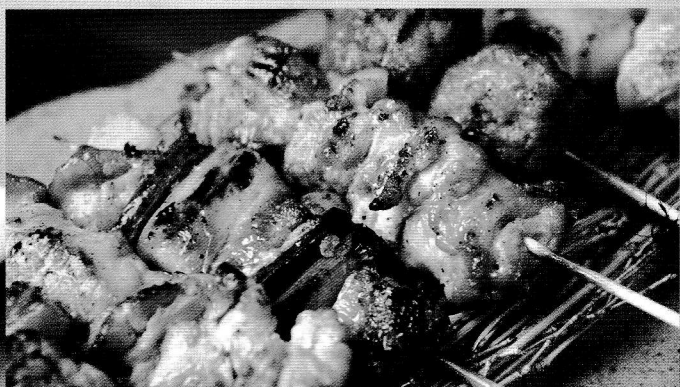
(株) 飼沼 ▶ 焼き鳥