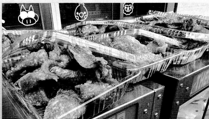
市場ミート ▶ コロッケ、皮せんべい