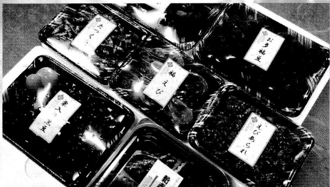
大松食品 (株) ▶ おせち