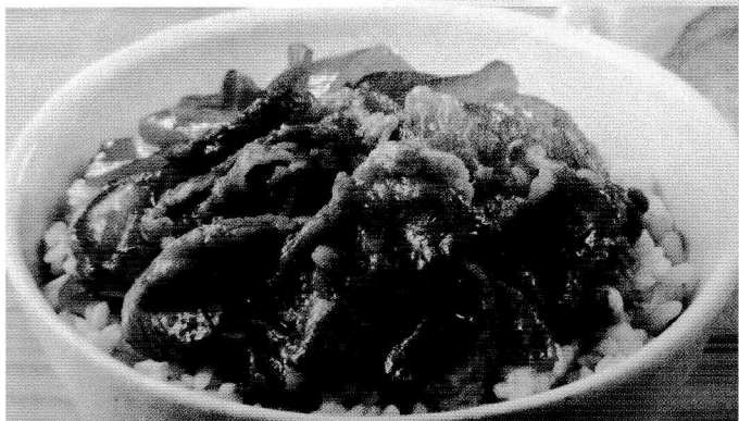
(有) 大垣ダイワ食品 ▶ 牛丼