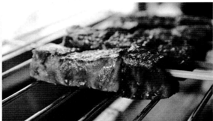
(株) 良和 ▶ 牛串