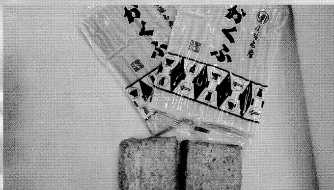
(株) 浅野屋 ▶ 1. がんもどき、厚揚げ 各種 1袋 120円 2. 角麩 1袋 120円