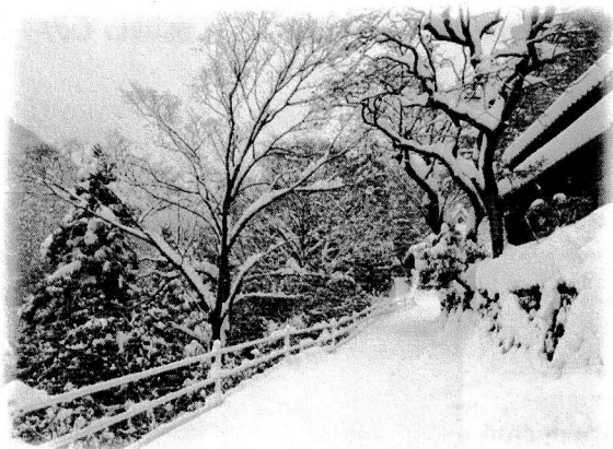
1月25日(木) 家の前の様子