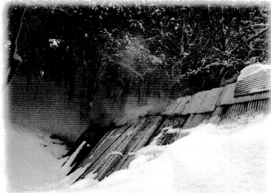
3回目の窯焚きの様子

その後、2回目3回目の窯焚きをすることができました。2回目の窯焚きでは、蓋をするまでの時間が短かったために煙の出口を狭く修正しました。3回目は2回目よりも8時間ほど長くなりました。このような技を少しでも多く吸収していきたいです。