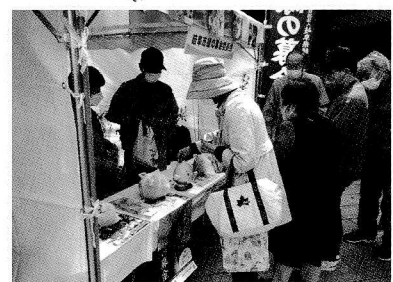
「緑の募金」街頭募金