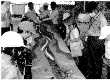
みどりの少年団の活動 (森林環境教育)