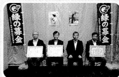
緑の募金感謝状贈呈