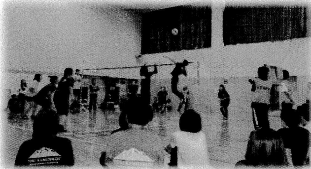
盛り上がった決勝戦

6月22日に時地区球技大会のソフトバレーがありました。今回、初めてソフトバレーに参加することができました！ 練習もして、けっこういけるのではないかと思います。そう簡単なものではありませんでした…。ふだんスポーツらしいスポーツはしていないので、パッパと大きく動くのはとても楽しかったです。決勝トーナメントは、すごい迫力で、見ていてカッコいいなあと思いました。