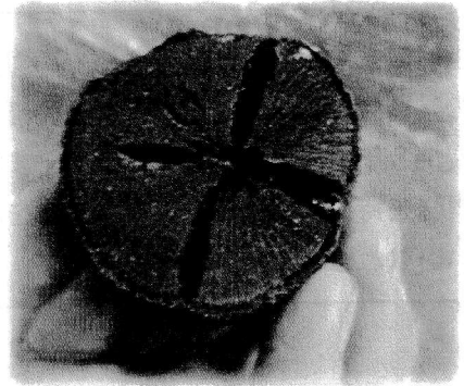
割れが少ない櫻の炭。こういう炭ができると嬉しくなります。なかなかの音です。準チンチン炭！

・・・失礼しました。3年目になりました。やっと師匠の手を借りなくても一通りの作業を行えるようになりました。作業をやれば、やるほど新しい発見と悔しい失敗があり、気持ちの浮き沈みもあります。伐る、割る、整える、立てる、火を付ける、蓋をする。それぞれの工程の結果が炭という結果になって、炭になるまで行ったことを覚えておかないと反省ができません。覚えが悪いのでなかなか上手いかないこともあります。チンチン炭を目指していきたいです！