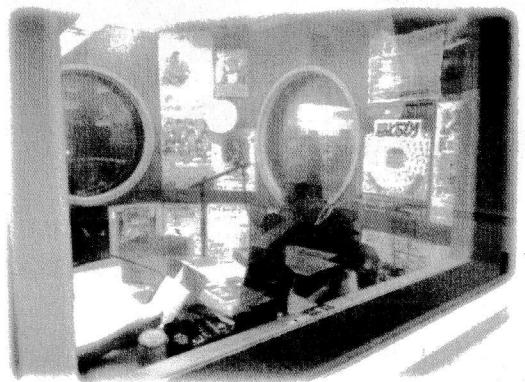
情報工房にあるFM岐阜スタジオにて

FM岐阜さんの「魅力発見！大垣」という番組で、現役の大垣市地域おこし協力隊の4名を紹介するというので、収録に行ってきました。他の3方の活動はあまり表に出てきていませんが、水面下でいろいろと動いています。ぜひラジオを聞いてください。どんどん活躍すると思いますので楽しみにしています。上石津町が持っている魅力が広がると嬉しいです。