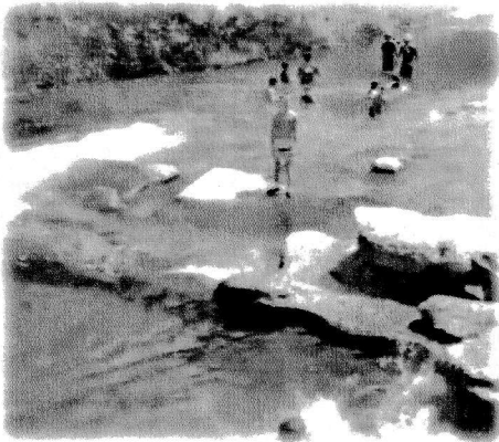
時 牧田川 学校橋にて

息子が参加している公民館講座では、いかだを作ったり川で遊んだり、子供にとってもいい夏が過ごせたのではないかと思います。