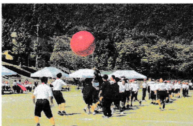
全校種目「大玉転がし」