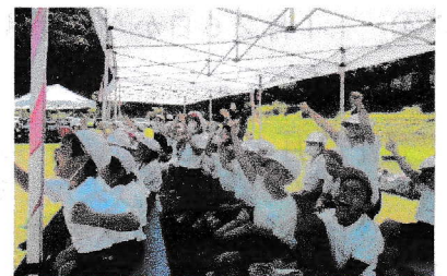
団席から全力で応援