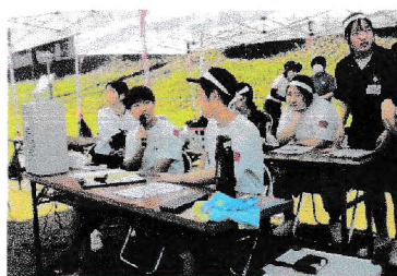
任された仕事を全力で